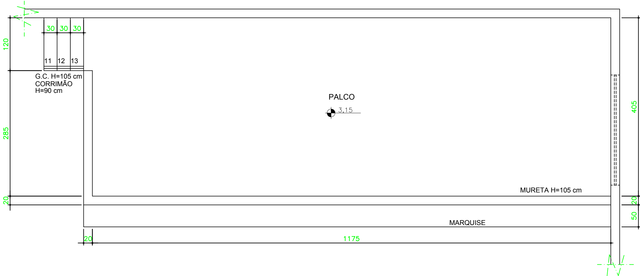
GINÁSIO POLIESPORTIVO - 2o. PAVTO PLANTA BAIXA ESC 1/750