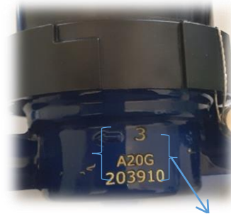
Número de identificação do hidrômetro

Toda ligação de água deverá conter hidrômetro, exceto em situações de inviabilidade técnica e econômica.